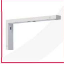
LA18038: Wall bracket ECOEXI 24M