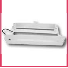
LA18037: Recessed frame ECOEXI 24M